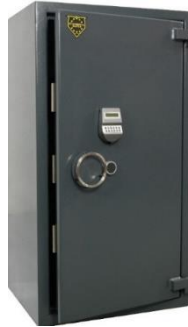
SBS 1300-19 (foto con opcionales)