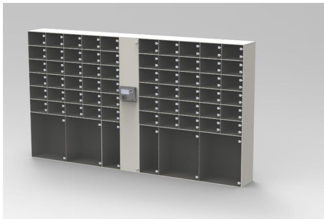
Compartimentos inteligentes configurables